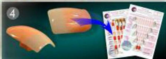
Fertige Nägel auf Übungskarten sammeln