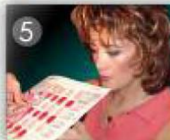
Beurteilung der Arbeit durch die Ausbilderin