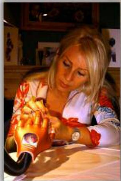
Expertin Sue Marsh: "Nur durch viel Übung werden Sie perfekt!"

Der Nail Trainer wird diese 60 Versuchspersonen für Sie als angehende Nail-Designerin ersetzen. Diese lebensnahe Übungshand hat bewegliche Finger, Silikon-Fingerkuppen und einsetzbare Übungsnägel. Im Gegensatz zu lebenden Modellen steht der Nail Trainer Ihnen immer zur Verfügung. Sie üben so oft und so lange wie Sie wollen. So werden Sie viel schneller zahlende Kunden bedienen, wodurch sich die Anschaffungskosten des Nail Trainers schnellstens rentieren. Ihre Kunden kommen immer wieder, weil sie von Ihren Fähigkeiten überzeugt sind.